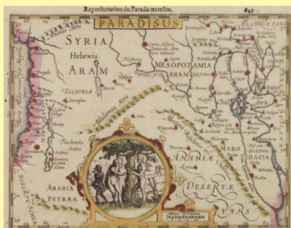
Paradiesdarstellung Gerhard Mercators im Mercator-Hondius Atlas minor von 1607