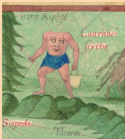
Kopflöse Mensch vermutete man in Asien und Amerika. Guillaume Le Testu: Detail aus „Cosmographie universelle“ (1556)