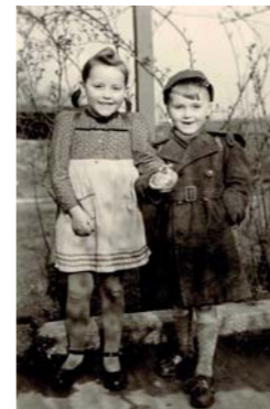
Schreib- zeiten: Aus der Anthologie „Sei still und sitz gerade“

Eintritt 6 €, ermäßigt 4 €, ein Getränk sowie der Besuch des Museums sind inklusive!