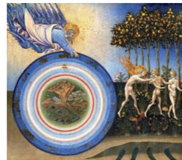
Das irdische Paradies nach Giovanni di Paolo 1445

Weltkarte des 16. Jh. hatte noch viele „weiße Flecken“. Diese füllten Mercator und seine Zeitgenossen mit den Ver- mutungen und Geschichten der rückkehrenden Seefahrer und Abenteurer. So gab es Berichte von geheimnisvollen Ländern, mystischen Orten, unermesslichen Reichtümern und mächtigen Königen, von Monstern und wilden Völkern.