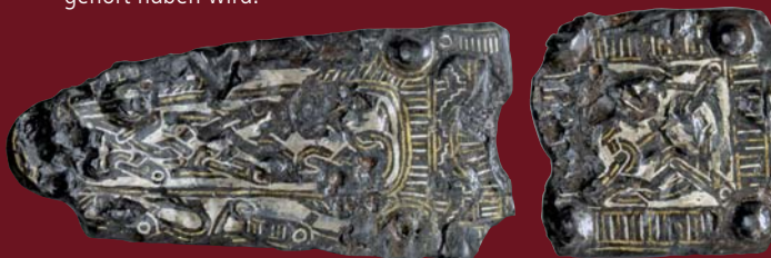
Fragmente eines Lederbeschlags, silbertauschiert, Gräberfeld Kantpark, 6.–8. Jh. n. Chr.

In Gregor von Tours' Weltgeschichte, „decem libri historiarum“, die er bis zum Jahr 591 schrieb, wird für die 430er Jahre erstmals „Dispargum“ als fränkischer Königssitz genannt. Unter Historikern war lange umstritten, um welchen heutigen Ort es sich dabei handelt. Tatsächlich mehren sich die Anhaltspunkte, dass es sich bei Dispargum nur um Duisburg handeln kann. Bei den Grabungen im Mercatorquartier wurden umfangreiche Siedlungsspuren auch des 5. Jahrhunderts ausgegraben, darunter eine Wallbefestigung mit innen liegenden Kasematten, die zu Gregors „Dispargum castrum“ gehört haben wird.