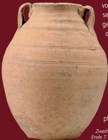
Zweihenkelkrug, Gräberfeld Kantpark, Ende 7. bis Anfang 8. Jh. n. Chr.

ermöglicht seit 2015 die Aufarbeitung von älteren Grabungen, die teilweise bereits im 19. Jahrhundert durchgeführt wurden. Die Auswertung dieser Altgrabungen in Verbindung mit den aktuellen Grabungsergebnissen eröffnen tiefgreifende neue Einsichten in die frühe Stadtgeschichte vom Übergang der Römerzeit in die fränkische Epoche um 400 n. Chr. und die darauf folgenden Entwicklungen bis zum Ende der Zeit als Kaiserpfalz um 1300.