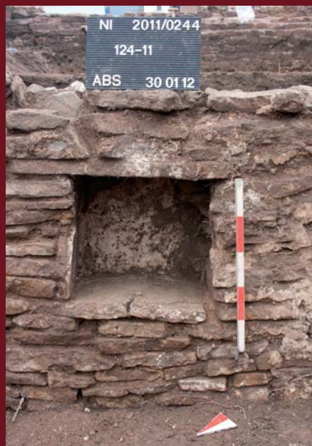
Keller an der Universitätsstraße, 10. Jahrhundert

Die erste Abteilung der Ausstellung zeichnet die Siedlungsentwicklung Duisburgs bis ins 8. Jahrhundert mit umfangreichen Grabfunden verschiedener Gräberfelder nach. Das zur frühmittelalterlichen