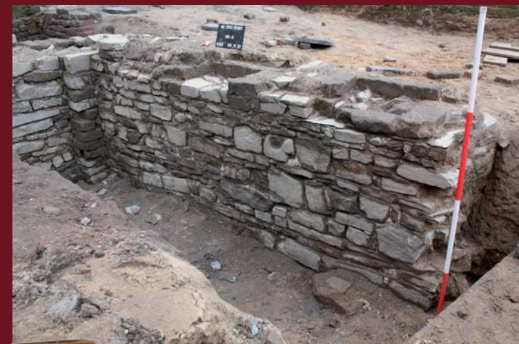
Keller im Mercatorquartier, 9. Jahrhundert

Ab dem 10. Jahrhundert diente der alte Königssitz als Pfalz der deutschen Kaiser. Die Baugeschichte der benachbarten Salvatorkirche konnte nach einer neuen Auswertung der Grabungsunterlagen umgeschrieben werden. Jetzt zeichnet sich eine überraschend andere Entwicklungsgeschichte der einstigen Pfalzkapelle ab, die sich nahtlos in die Reihe vergleichbarer Bauten, etwa der Kaiserpaläen Ingelheim oder Werla, fügt. Die neuen Grabungen in der Innenstadt ermöglichen es nun, eine detaillierte Vorstellung über Aussehen und Entwicklung von Pfalz und Stadt zu geben.