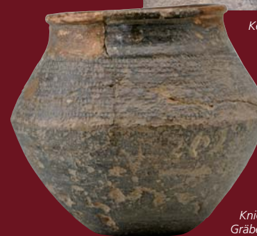
Knickwandtopf mit Rollrädchenverzierung, Gräberfeld Kantpark, 1. Hälfte 7. Jh. n. Chr.

Das Ende der Kaiserpfalz im späten 13. Jahrhundert bedeutete aber nicht den Niedergang, sondern den Übergang zu einer bedeutenden Bürgerstadt, die als Handelsstadt auch Teil der Hanse war. Diese und andere neue Ergebnisse stehen im Mittelpunkt der zweiten Ausstellungsabteilung.