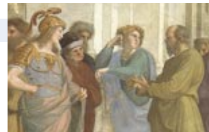
Foto: Raffael, Die Schule von Athen (Ausschnitt), 1510/11. Vatikan, Stanza della Segnatura.

Die große Frage, die der Vortrag aufgreift und zu beantworten versucht, lautet: Wie kam es, daß das kleine Europa, genauer: dessen westlicher Teil und dann das von Europa geprägte Amerika, bis ins 20. Jahrhundert die in wissenschaftlicher und technischer Hinsicht bei weitem erfolgreichste Region der Welt war, während die bis ins 12. Jahrhundert führenden islamischen Länder und China Niedergang erlebten? Es wird nicht darum gehen, allein eine Triumphgeschichte zu erzählen; die dunkle Seite des „Aufstiegs Europas“ wird nicht ausgeblendet werden. Nicht zuletzt die Europäerinnen und Europäer selbst hatten teuer dafür zu bezahlen. Vergleiche sollen zeigen, welche Voraussetzungen für die Karriere des Kontinents wichtig, vielleicht entscheidend waren. Dazu zählten seine politische und kulturelle Vielfalt, Freiheiten und die Existenz von Mittelschichten, die Eindämmung der Macht der Religion und das antike Erbe mit seinem kritischen Geist. Entscheidend war die Offenheit Europas für Kulturtransfers: die Bereitschaft, vom Fremden zu lernen. Ein Ausblick wird sich mit der Frage beschäftigen, ob das europäisch-amerikanische Zeitalter inzwischen seinem Ende entgegengeht und die Zukunft China und anderen Ländern Asiens gehören könnte.