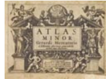
Titelblatt eines „Atlas Minor Gerardi Mercatoris“

Auch mit einem neuen Format hatte Hondius großen Erfolg: Sein „Atlas Minor Gerardi Mercatoris“ hatte nur ein Drittel der Größe der Normalausgabe, war preiswerter und z. B. auf Reisen viel handlicher. Er enthielt neu gestochene Karten und verkürzte Texte. Hondius nutzte die hohe Bekanntheit, die mit dem Begriff Atlas und dem Namen Mercator verbunden waren.