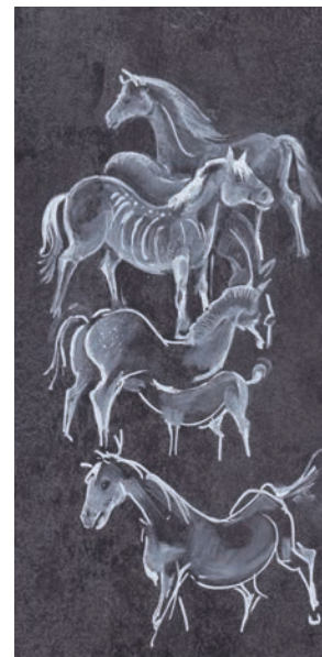
Tierische Typen: Duisburger Wildpferde (Zeichnung: Jörg Mazur)

29.10.23 VORTRAG So Viel zu langsam viel erreicht – Frauenrechte 11:15 Uhr Barbara Sichtermann Mercator Matinée Museum für Kultur- und Stadtgeschichte