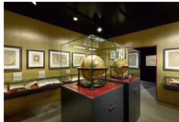
Blick in „Mercators Schatzkammer“

Historisches Zentrum Duisburg Anfahrt ÖPNV: Ab Duisburg Hbf mit der U-Bahn Linie 901 Richtung Marxloh/Ruhrort bis Haltestelle „Rathaus Duisburg“, von dort ca. 3 Minuten Fußweg Parkplätze am Rathaus oder im „Parkhaus City“ Unterstraße 19