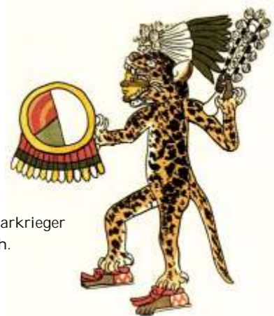
Tierischer Typ: Jaguarkrieger der Azteken im 16. Jh.

28.01.24 FAMILIENFÜHRUNG So Reise von der Eiszeit bis in die Gegenwart 15 Uhr Werner Pöhling Kultur- und Stadthistorisches Museum