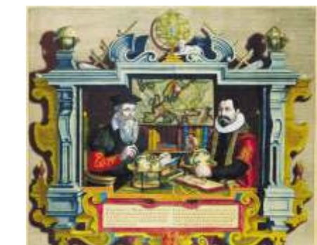
Gerhard Mercator und Jodocus Hondius